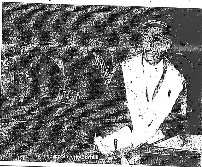
Francesco Saverio Borrelli

Perciò viva Borrelli e tutti quei magistrati che con coraggio si battono perché la "Legge sia uguale per tutti".